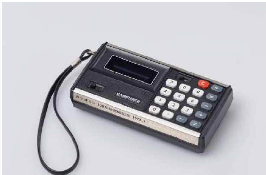
図表 6.2 カシオミニ